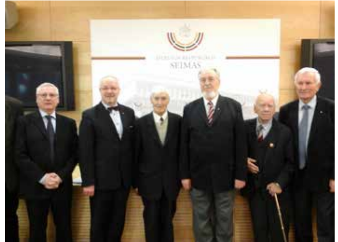
Lietuvos visuotinių žmogaus teisių gynimo deklaracijos signatarai.

Iškilingam minėjimui baigiantis Lietuvos visuotinių žmogaus teisių gynimo deklaracijos signatarai įsiamžino bendroje nuotraukoje.