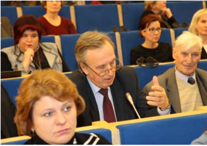
Tarptautinė konferencija LR Seime „Vaiko teisių apsauga: ar valstybė perims tėvų vaidmenį?“

bos dėl problemų su vaikais, ir neretai tai galiausiai baigiasi prievartiniu atėmimu. Vaikai taip pat paimami iš tėvų pasiskundus patiems vaikams.