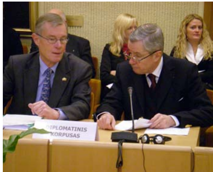
Konferencijoje užsienio šalių diplomatai

Tiesa, anot D.Jocienės, mūsų šalyje kol kas išlieka tiek baudžiamojo, tiek civilinio procesų ilgumo problema pagal Konvencijos 6 straipsnį. Jos nuomone, Lietuva iki šiol neįvykdė Strasbūro teismo sprendimo dėl lyties