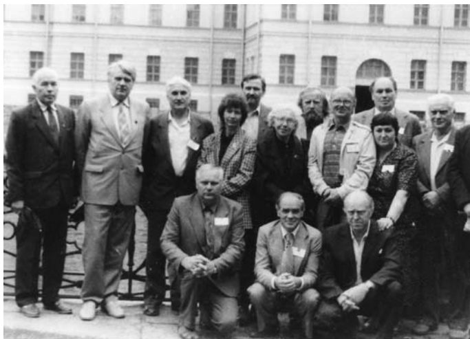
Lietuvos Helsinkio grupės nariai sąjunginiame politinių kalinių suvažiavime Leningrade (Peterburgas). 1990 m.