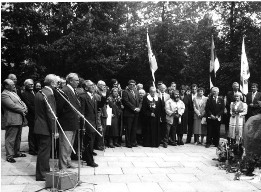
Viktoras Petkus mitinge Tartu mieste. 1990 m

Kai pirmąkart, dar Stalino laikais, sėdėjau lagery, kartu kalėjo ir daug senosios lietuvių inteligentijos atstovų. Šie žmonės mus mokė, kad nepersiimtume prieš papročiais, nesivadovautume jų gyvenimo normomis. Tačiau dešimtmečiais gyvenant diasporoje, svetimųjų apsuptyje, norom nenorom aplinka pradeda veikti mūsų sąmonę, įpročius ir poelgius. Dar neseniai tie, kas išdrįsdavo pakritikuoti valdžią ir jos darbus, būdavo suimami ir išgabenami Šiaurėn, į Sibirą. Tokio žmogaus suėmimą bemaž visada remdavo visuomenė. Gera valia ar