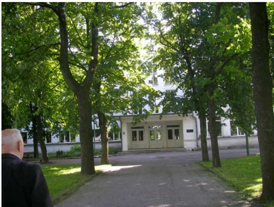
Raseinių Viktoro Petkaus pagrindinė mokykla. V.Petkus savo gimtojoje mokykloje paskutinį kartą lankėsi 2010 m.