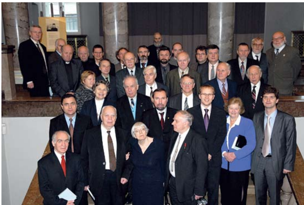
Lietuvos Helsinkio grupės steigėjai, grupės nariai, rėmėjai ir užsienio šalių Helsinkio grupių atstovai Lietuvos Helsinkio grupės 30-čio minėjime. Vilnius, 2007 m.