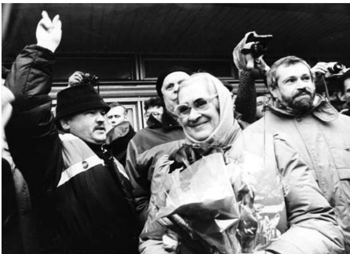
Vilniuje po tragiškų Sausio 13-osios įvykių apsilankė žymaus rusų disidento ir žmogaus teisių gynėjo A.Sacharovo žmona Elena Bonner. Už jos stovi Viktoras Petkus. Prie Spaudos rūmų, 1991 m.

Šaltiniai: „Pozicija“.- 1990 m . rugpjūčio 26 d., „ Tiesa“.- 1992 m. birželio 13 d., „Pozicija“.-1992 m. birželio 23-28 d., „Nepriklausoma Lietuva“.-1992 m rugpjūčio 5 d., „Pozicija“.-1993 m. kovo 3 d., „Pozicija“.- 2008 m. IV ketvirtis, „Pozicija“.- 2009 m. sausis- gegužė., „Pozicija“.- 2009 m. III ketvirtis.