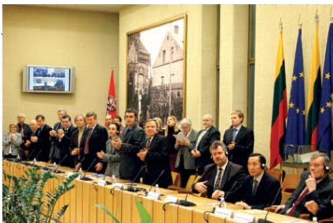
Konferencija "Lietuvos Helsinkio grupė. Susitikimas po 30-ties metų" LR Seimo Konstitucijos salėje. 2007 m.