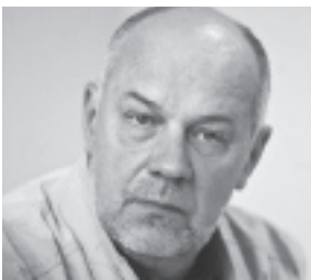
Nepartinio demokratinio judėjimo tarybos narys, socialinių mokslų daktaras, Vilniaus universiteto profesorius Romas Lazutka: